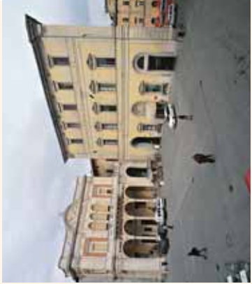
Palazzo Vitelli a Sant'Egidio

nell'odierna piazza Matteotti in posizione dominante nel cuore della città: quello più piccolo di San Giacomo sul lato nord, verso l'omonima porta: il prestigioso palazzo Vitelli alla Cannoniera, sede della pinacoteca comunale, voluto da Alessandro Vitelli; il palazzo Vitelli a Sant'Egidio con affreschi di Cristoforo Gherardi e Prospero Fontana e con il giardino culminante nella palazzina Vitelli.