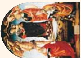
Londra, National Gallery, Luca Signorelli, Madonna con il Bambino e santi

Ad acquistare il palazzo per farne dono al Comune e allestirvi la pinacoteca fu il fiorentino Elio Volpi, che, dopo un'iniziale attività di pittore e poi di restauratore, aveva realizzato enormi profitti con il commercio antiquario. Pregevoli, oltre alla sobria architettura rinascimentale, sono i monocromi della facciata verso il giardino realizzati da Cristoforo Gherardi forse su disegno del Vasari e le pitture