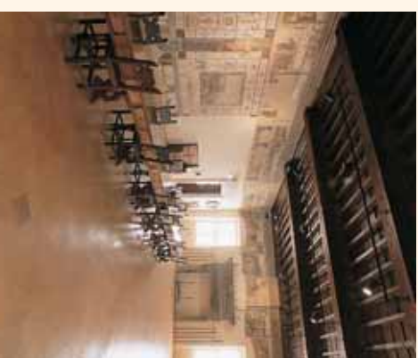
Salone con decorazioni di Cristoforo Gherardi e Cole dell'Amatrice

A ricchi committenti di Città di Castello è destinata buona parte dell'attività oggi più celebre del Rinascimento: Raffaello. Cresciuto a fianco del Perugino tra Perugia e Firenze, l'urbinate lasciò nella città tiberina ben quattro opere, tre delle quali purtroppo emigrate. La prima, realizzata intorno al 1501 e ancora molto legata allo stile del maestro, era una pala d'altare dedicata a san Nicola da Tolentino, originariamente nella chiesa di Sant'Agostino e ora smembrata in diversi musei. Ben più note, anche per la loro qualità artistica, le altre due tavole destinate ad altrettanti alconi di importanti famiglie tiferne: la Crocifissione dipinta nel 1508 per la famiglia De' Gavari, già nella chiesa di San Domenico e oggi alla National Gallery di Londra, e lo Sposalizio della Vergine eseguito l'anno successivo per la cappella Albizzini in San Francesco e attualmente nella milanese Pinacoteca di Brera. L'unico lavoro di Raffaello rimasto in città e oggi conservato in pinacoteca è il gonfalone processionale della chiesa della Santissima Trinità, databile agli stessi anni. La fortuna di Raffaello a