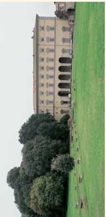
Palazzo Bufalini Vitelli

nell'odierna piazza Matteotti in posizione dominante nel cuore della città: quello più piccolo di San Giacomo sul lato nord, verso l'omonima porta: il prestigioso palazzo Vitelli alla Cannoniera, sede della pinacoteca comunale, voluto da Alessandro Vitelli; il palazzo Vitelli a Sant'Egidio con affreschi di Cristoforo Gherardi e Prospero Fontana e con il giardino culminante nella palazzina Vitelli.